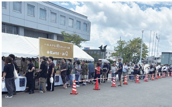
写真5 えべつ農業まつり2025

「江別小麦めん」を使用したラーメンが全国テレビで紹介されるなどの宣伝効果も手伝って、ハルユタカブレンド麺は道内外へ出荷されている。また、小麦粉はラーメンだけでなくパンやピザ等にも利用され、「ハルユタカ」を求めるファンは多い。「日本一予約の取れないラーメン店」とも言われる店のラーメンにも「ハルユタカ」が採用され、現在も交流を続けている。さらには、2024年にはテレビ番組「鉄腕ダッシュ」の企画で「幻の小麦」として紹介され、「ハルユタカ」を使用したハンバーガーのバンズが話題となった。