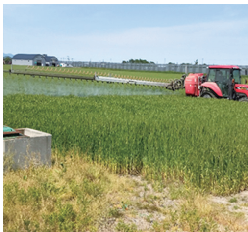
写真4 葉色値の低いほ場では葉面散布を実施