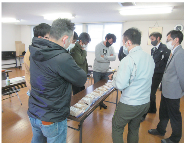
写真3 江別市麦採種生産部会勉強会の様子

種子生産にあたっては、市内農家5戸で生産している。栽培方法は、生育のばらつき解消と品質の安定化のため春まき栽培で統一している。農業者自らによる全筆のほ場巡回や目合わせ会の実施により、意識向上を図っている。ほ場ごとに適期収穫を徹底しており、高品質な種子が生産されている。春まき栽培でも収量レベルは高く、地域平均を大きく上回っている。