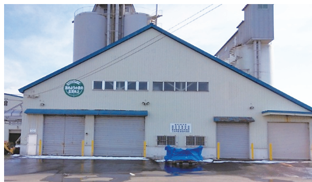
写真2 JA道央麦調製保管出荷施設

JAと連携し、かび毒に汚染された小麦が出荷されないよう、自主的にDON検査を行い、安心安全な小麦生産に取り組んでいる。「ハルユタカ」は穂発芽や赤かび病に弱いことから、亜リン酸資材を2～3回散布し穂発芽抑制、DON汚染軽減を図っている。また、慣行の春まき栽培より成熟期が1週間程度早くなるため、適期収穫に向けて計画的に収穫・乾燥を行い、高品質安定小麦生産につなげている。