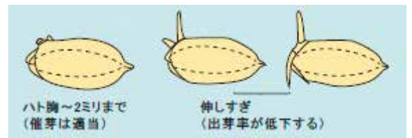
図1 催芽の程度 (星川、1975年)