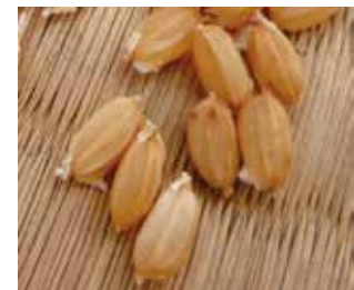
写真4 催芽が適当な状態の籾