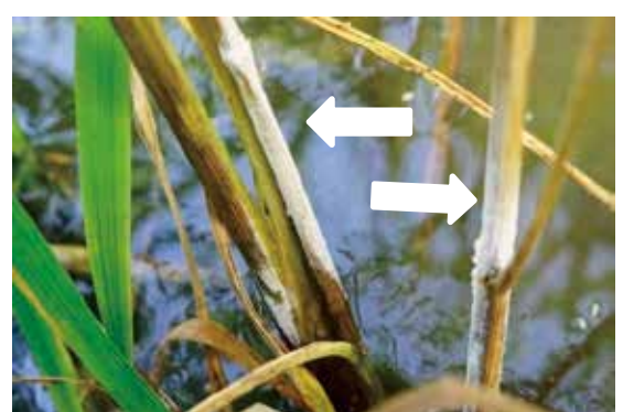
写真7 枯死株上の胞子(矢印)