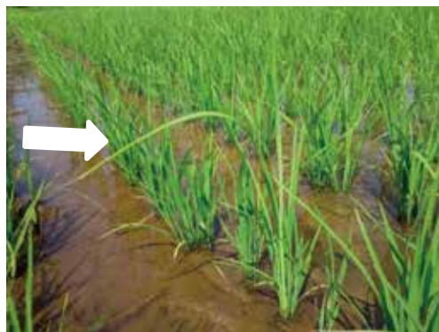
写真6 本田における発病株(矢印)