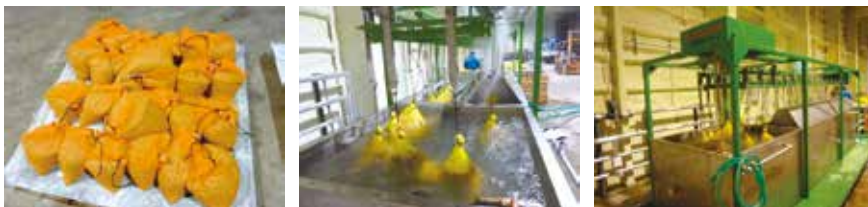
写真2 温湯消毒の様子