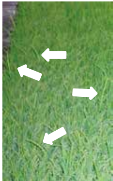
写真5 苗床における発病株(一部に矢印)