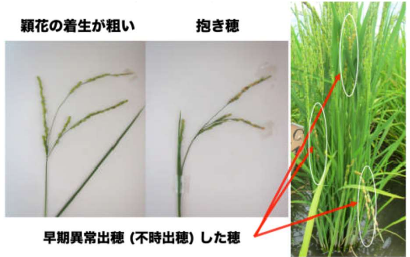
写真3 早期異常出穂した穂の形態的特徴