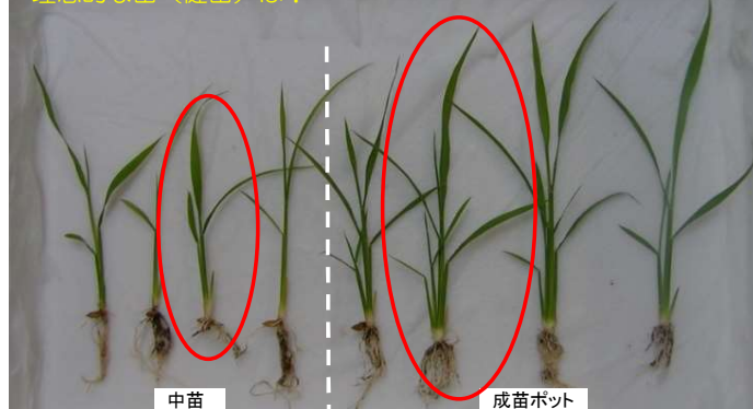
写真2 中苗と成苗ポットにおける苗の比較