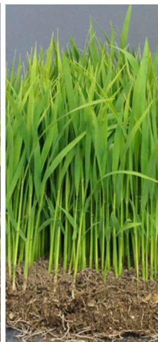
密播中苗 (乾籾200g_30日_2.8葉)