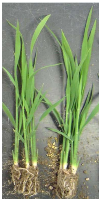
成苗ポット (乾籾40g_30日_3.6葉)