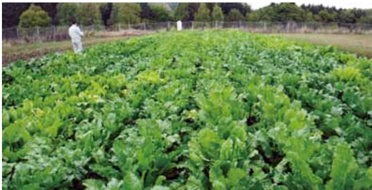
そう根病抵抗性検定試験圃場