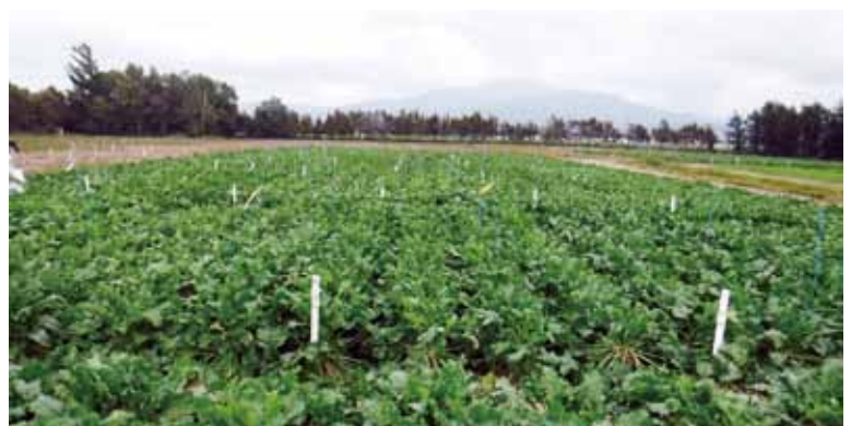
斜里町現地検定試験圃場