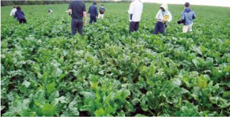
美瑛町現地試験圃場

北海道農産協会では、てん菜の優良品種認定に向け、輸入品種の生産力とその特性を調査し、決定上の基礎資料とするために、各種品種検定試験を北海道立総合研究機構に委託し、道内各地で生産力検定試験・特性検定試験並びに現地検定試験を実施