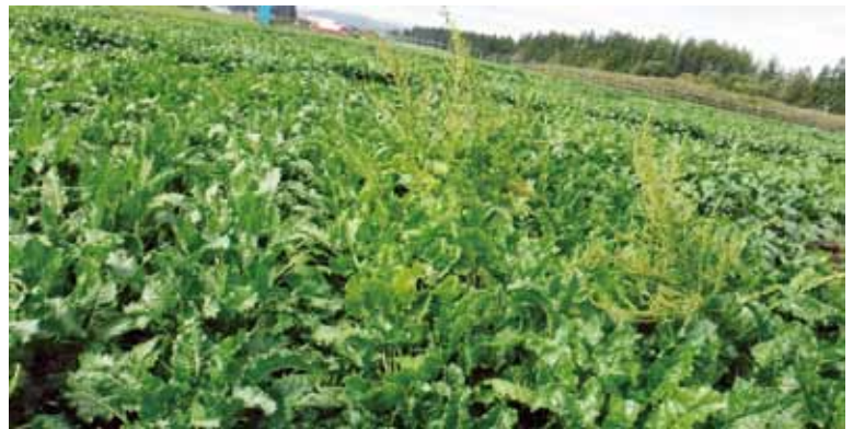
抽苔性検定試験圃場