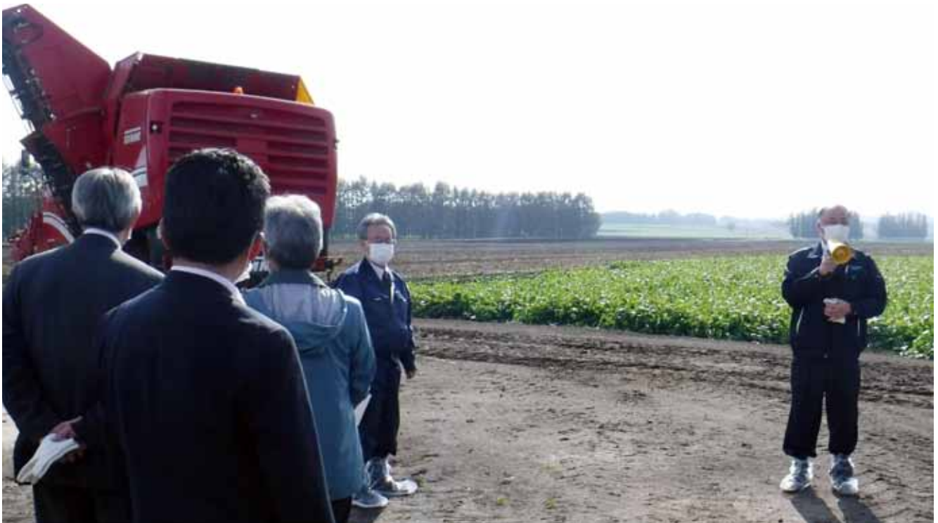
てん菜受渡等現地調査（十勝管内）

発行／一般社団法人北海道農産協会／〒060-0004 札幌市中央区北4条西1丁目 ☎011-221-2542 FAX011-221-1815 URL https://hokkaido-nosan.or.jp